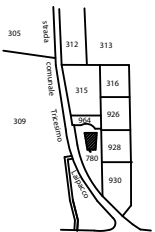
Comune di Tricesimo Fig. 11 - mapp. 315 Scala 1:2000